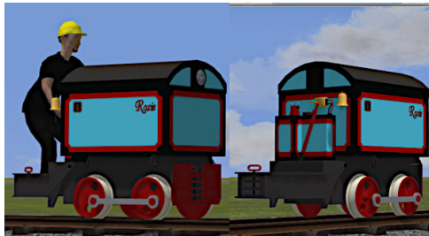
B.E.V. WR5, Rosi Nr. I, AKKU mit rundem Deckel, mit Lampe (vorn) und Glocke