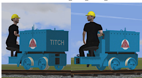
Titch, Umbau mit Traktorsitz, 1982, Great Bush Railway