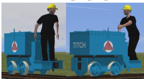
Titch, Fabriknummer M7535, Baujahr 1972, Crowborough Brickworks (9 Jahre operativer Einsatz)