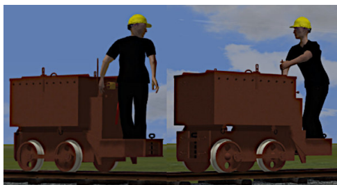
B.E.V. WR5, rostfarben