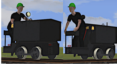
B.E.V. WR5 in schwarz mit Lampe und Glocke