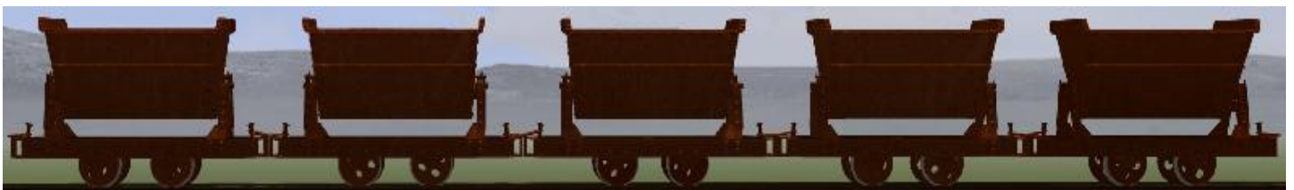
Lore in 'Rost' mit unterschiedlicher Lehm- und Ton-Ladung (die Mulden lassen sich kippen) – insgesamt 19 Modelle.

Die Lehm- bzw. Ton-Ladung entspricht den Weihnachts-Modellen von 2013, zwei weitere Variante mit hellerem und rotem Lehm sind dazu gekommen.