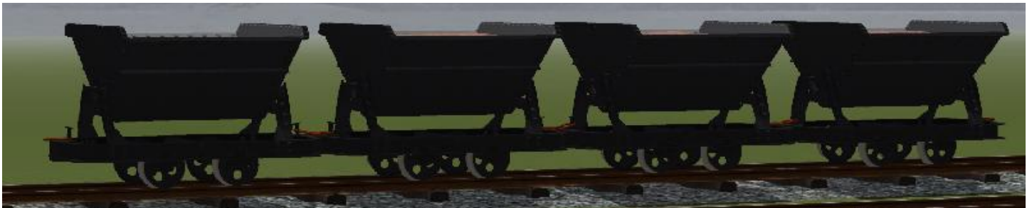
Lore in 'Schwarz' mit unterschiedlicher Lehm- und Ton-Ladung (die Mulden lassen sich kippen) – insgesamt 19 Modelle.