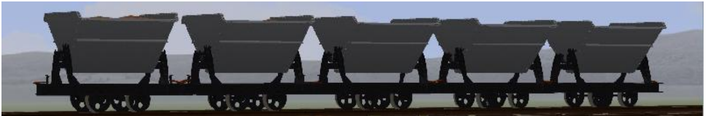
Lore in 'Grau' mit unterschiedlicher Lehm- und Ton-Ladung (die Mulden lassen sich kippen) – insgesamt 19 Modelle.

In diesem Set sind zunächst weitere Varianten der DIN-Loren enthalten: