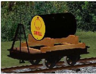
Benzinlore SHELL – (Modellname: Benzinlore_SHELL_schwarz(-oB))