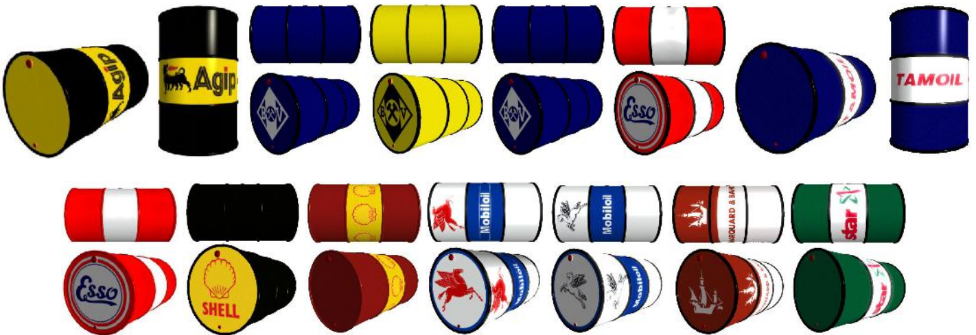
(enthalten in: V80NKK10031)

Alle Benzinfässer werden auch als Immobilie installiert (jeweils stehend und liegend).