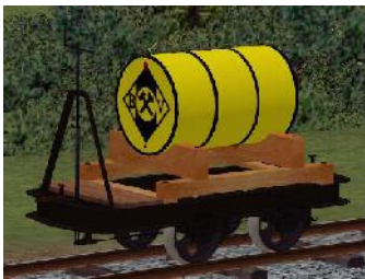
Benzinlore BV – (Modellname: Benzinlore_BV_gelb(-oB)