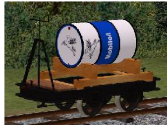
Benzinlore MOBILLOIL – (Modellname: Benzinlore_Mobiloil_alt(-oB))