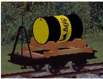
Benzinlore AGIP – (Modellname: Benzinlore_AGIP(-oB)