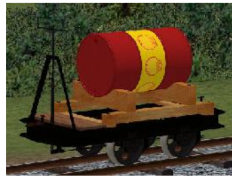
Benzinlore SHELL – (Modellname: Benzinlore_SHELL_rot(-oB))