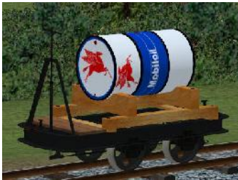
Benzinlore MOBILLOIL – (Modellname: Benzinlore_Mobiloil(-oB))