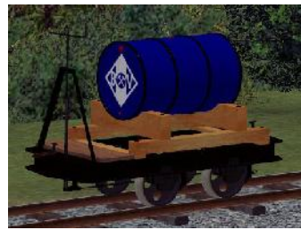
Benzinlore BV blau – (Modellname: Benzinlore_BV_blau(-oB)