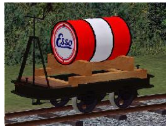
Benzinlore ESSO – (Modellname: Benzinlore_ESSO(-oB)