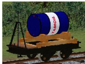
Benzinlore TAMOIL – (Modellname: Benzinlore_TAMOIL(-oB) (enthalten in: V80NKK10031)