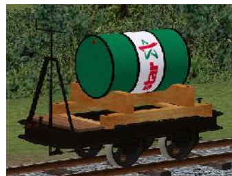
Benzinlore STAR1 – (Modellname: Benzinlore_STAR1(-oB)) (enthalten in: V80NKK10031)