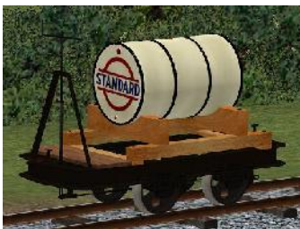
Benzinlore STANDARD – (Modellname: Benzinlore_STANDARD(-oB)