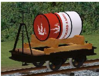
Benzinlore B&M – (Modellname: Benzinlore_B&M(-oB))