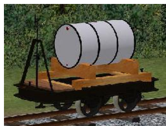
Benzinlore grau – (Modellname: Benzinlore_grau(-oB)