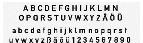
ABC - Alte DIN 1451.tga