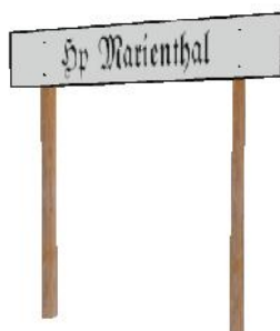
Bhf Schild 001