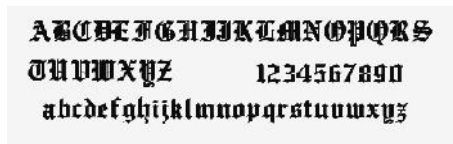
ABC - EnglishTown.tga