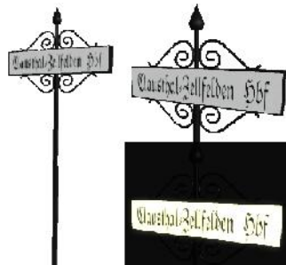
Bhf Schild 002