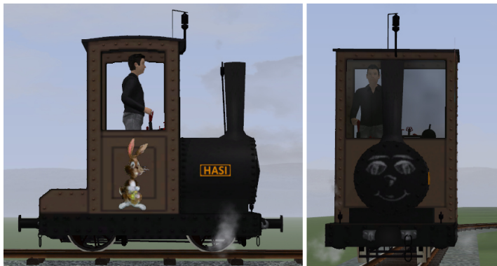
Lok olivbraun, Fahrwerk schwarz, Gesicht auf Rauchkammertür (keine Glocke), schwarze Pfeife und Ventile (Modellname: B2nt HASI (KK1) – Dateiname: AA_HASI_KK1) (ursprünglich in V11N_WBF_Ostern2018 enthalten)

Die folgenden Modelle sind als Userwunsch von Dennis aus Kopenhagen entstanden: