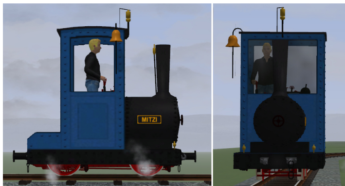
Lok blau, Fahrwerk rot, goldene Glocke, Pfeife und Ventile (Modellname: Bn2t MITZI (KK1) – Dateiname: AA_MITZI_KK1)