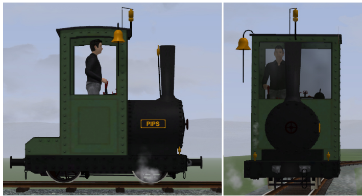
Lok grün, Fahrwerk schwarz, goldene Glocke, Pfeife und Ventile (Modellname: Bn2t PIPS (KK1) – Dateiname: AA_PIPS_KK1)