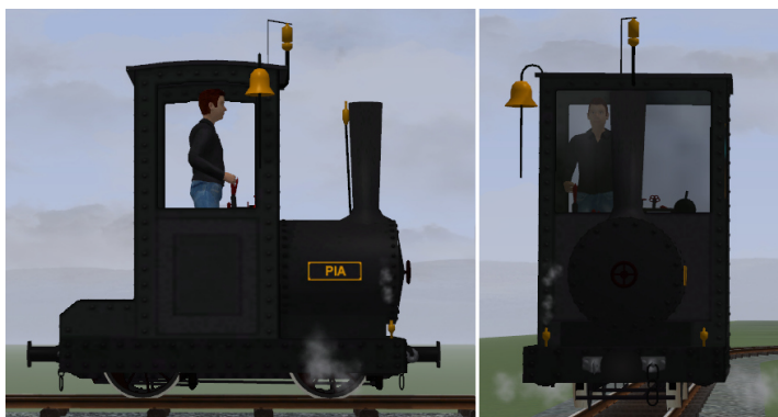
Lok dunkelgrau, Fahrwerk schwarz, goldene Glocke, Pfeife und Ventile (Modellname: Bn2t PIA (KK1) – Dateiname: AA_PIA_KK1)