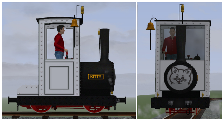
Lok hellgrau, Fahrwerk rot, Gesicht auf Rauchkammertür, goldene Glocke, Pfeife und Ventile (Modellname: Bn2t KITTY (KK1) – Dateiname: AA_KITTY_KK1)