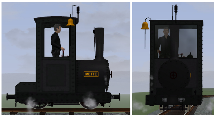
Lok dunkelgrau, Fahrwerk schwarz, goldene Glocke, schwarze Pfeife und Ventile (Modellname: Bn2t METTE (KK1) – Dateiname: AA_METTE_KK1)