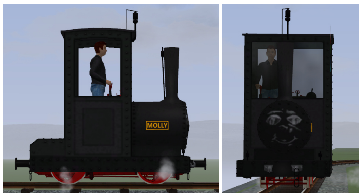
Lok schwarz, Fahrwerk rot, Gesicht auf Rauchkammertür (keine Glocke), schwarze Pfeife und Ventile (Modellname: Bn2t MOLLY (KK1) – Dateiname: Bn2t_MOLLY_KK1) (ursprünglich in V80_WX2017 enthalten)