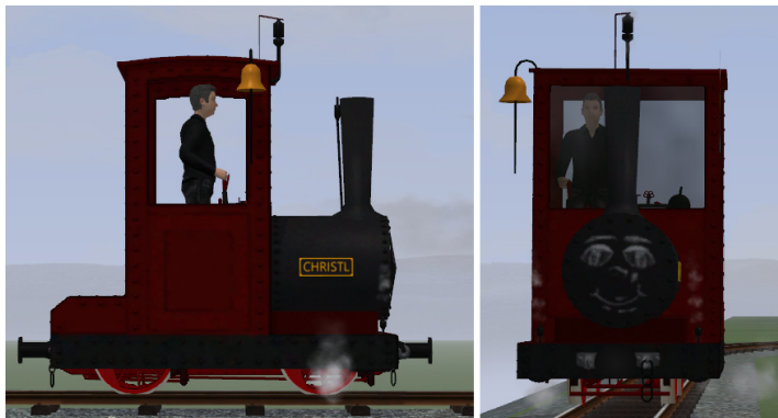
Lok dunkelrot, Fahrwerk rot, Gesicht auf Rauchkammertür, goldene Glocke, schwarze Pfeife und Ventile (Modellname: Bn2t CHRISTL (KK1) – Dateiname: AA_CHRISTL_KK1) (ursprünglich in V80_WX2017 enthalten)