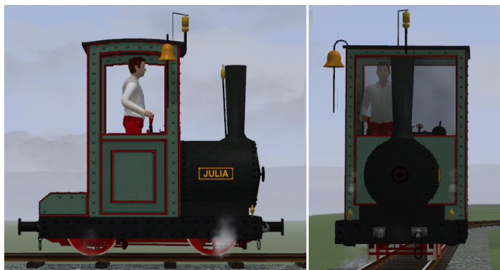
Lok grün – rot abgesetzt, Fahrwerk rot, goldene Glocke, Pfeife und Ventile (Modellname: Bn2t JULIA (KK1) – Dateiname: AA_JULIA_KK1)