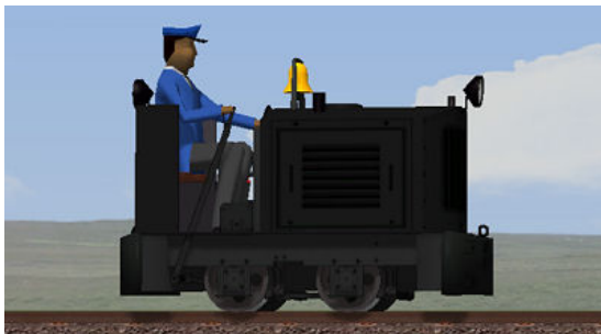
Ns1 schwarz Fabriknummer 47038, Baujahr 1952. Mit goldener Glocke und kleinem Auspuff.