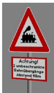
1938 BÜ Achtung 2 1956 unbekannter Standort