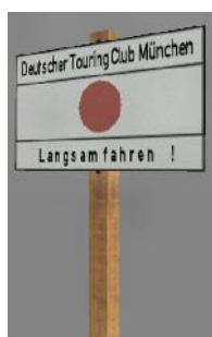
19?? Langsam fahren