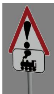
1938 BÜ ! Dampflok 1989 in Glauchau