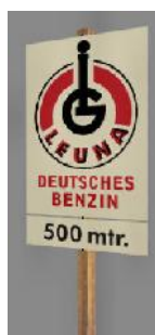
19?? LEUNA 500m