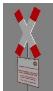
1938 BÜ geschlossen