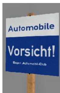
19?? Automobile Vorsicht