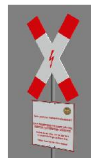
1938 BÜ geschlossen el Gremberg