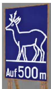
19?? Wildwechsel 500m