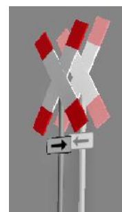
1938 BÜ rechts/links

(Dateiname: 1938_063_KK1 - 1938_072r(l)_KK1 – enthalten in: V80N_WBF_VZ_003)