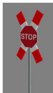
1938 BÜ X-Stop Marienfeld/Verl (2009)