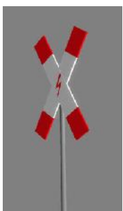
1938 BÜ X el