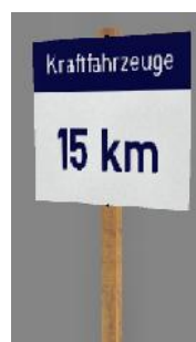
19?? Kraftfahrzeuge 15km

(Dateiname: 1938_000b_KK1 - 1938_000h_KK1 – enthalten in: V80N_WBF_VZ_003)