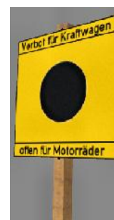
19?? Verbot für Kraftwagen