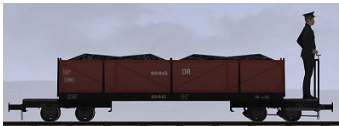
Werdau, Bj 1918 – 03-045 – Museumszug (Dateiname: WEM_Kohlenwagen_03_045_KK1 - Modellname: WEM Kohlewagen 03-045)