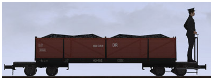
??, Bj 1919 – 03-052 – Museumszug (Dateiname: WEM_Kohlenwagen_03_052_KK1 - Modellname: WEM Kohlewagen 03-052)

Alle Modelle sind in V11N_WBF_SS6_049 enthalten.