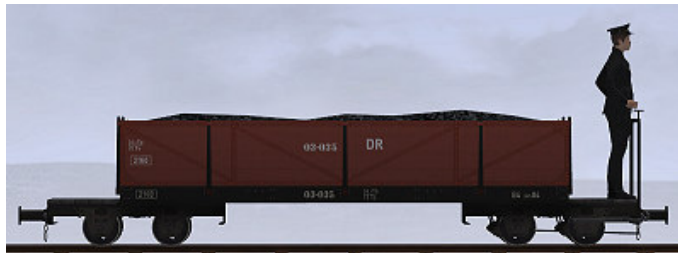
Busch, Bj 1918 – 03-035 – auch als Personenwagen einsetzbar (Dateiname: WEM_Kohlenwagen_03_035_KK1 - Modellname: WEM Kohlewagen 03-035)