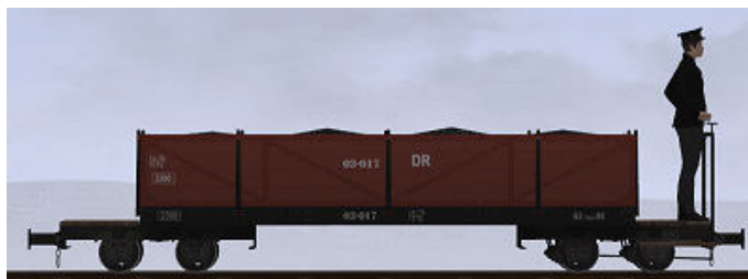
O&K, Bj 1918 – 03-017 – auch als Personenwagen einsetzbar

(Dateiname: WEM_Kohlenwagen_03_011_KK1 - Modellname: WEM Kohlewagen 03-011)