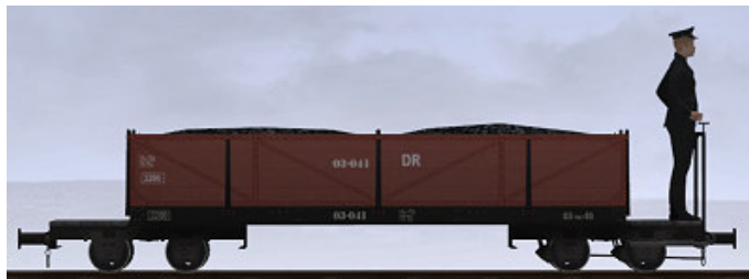
J.P. Goossens, Bj 1918 – 03-041 – Museumszug (Dateiname: WEM_Kohlenwagen_03_041_KK1 - Modellname: WEM Kohlewagen 03-041)