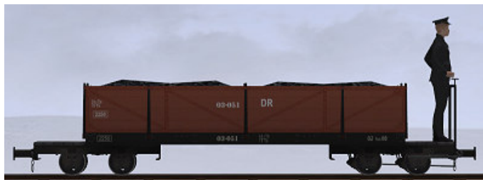
Glässing & Schollwer, Bj 19?? – 03-051 – Museumszug (Dateiname: WEM_Kohlenwagen_03_051_KK1 - Modellname: WEM Kohlewagen 03-051)