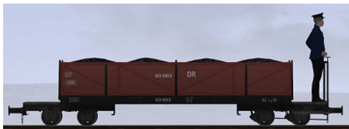
Busch, Bj 1918 – 03 – Museumszug

(Dateiname: WEM_Kohlenwagen_03_003_KK1 - Modellname: WEM Kohlewagen 03-003)