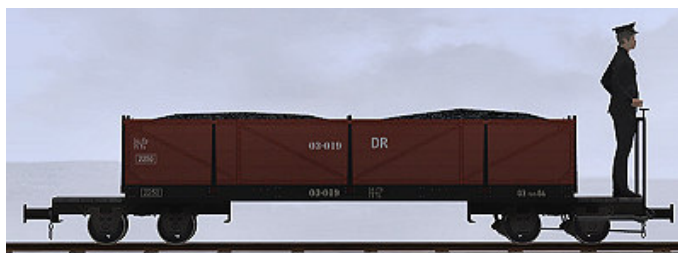
O&K, Bj 1918 – 03-019 – auch als Personenwagen einsetzbar

(Dateiname: WEM_Kohlenwagen_03_017_KK1 - Modellname: WEM Kohlewagen 03-017)