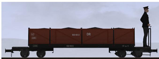
??, Bj 1918 – 03-011 – auch als Personenwagen einsetzbar

(Dateiname: WEM_Kohlenwagen_03_003_KK1 - Modellname: WEM Kohlewagen 03-003)