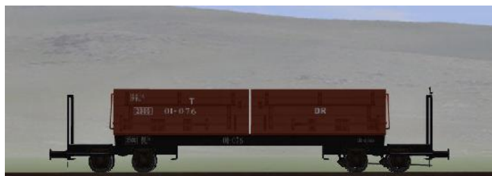
Umbau nach 1950 (WEM) – 01-076 – (DR – Rahmen genietet – graue Sitzbänke) (Modellname: WEM_Personenwagen_01_076 – enthalten in: V70NKK10)