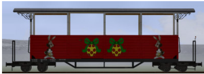
GPW 22 halboffen mit Traglastenabteil in Rot – (Modellname: WEM_Pers 107 Ostern – enthalten in: V80N_WBF_Ostern2016)