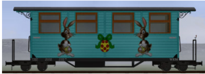
GPW 22 in Hellblau – (Modellname: WEM_Pers lang Ostern – enthalten in: V80N_WBF_Ostern2016)