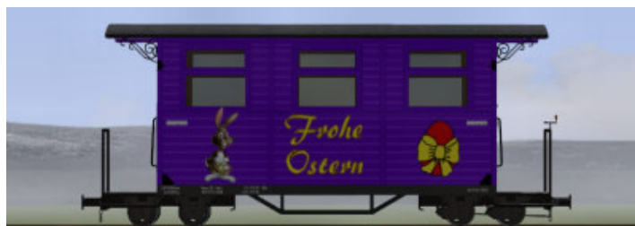
GPW 16 Salonwagen in Lila – (Modellname: WEM_Salon Ostern – – enthalten in: V80N_WBF_Ostern2016) Der Salonwagen hat zwei Sitzbänke in Längsrichtung und einen großen Schrank.