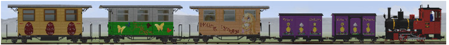
Und so sieht der „Oster-Zug 2017 mit Zuglok Bn2t OSTERN (enthalten in: V80N_WBF_Ostern2015_02 ) aus.