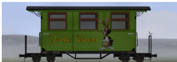
GPW 16 – Wagen in Grün – (Modellname: WEM_Pers Ostern – enthalten in: V80N_WBF_Ostern2016)