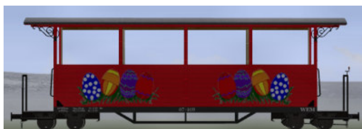
GPW 22 halboffen in Rot – (Modellname: WEM_Pers ho Ostern – enthalten in: V80N_WBF_Ostern2016)