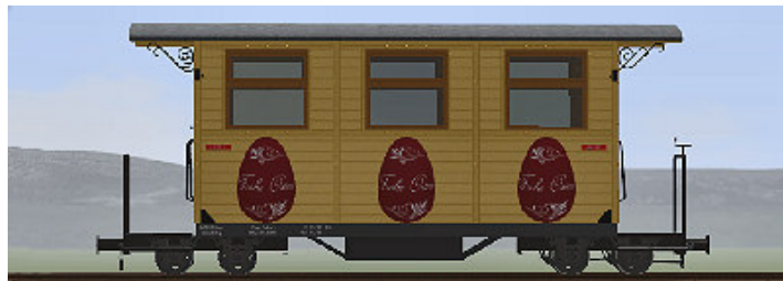
GPW 16 – Wagen in Gelb – (Modellname: WEM_Pers Ostern 2017_1 – enthalten in: V80N_WBF_Ostern2017)