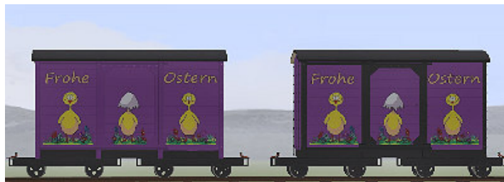
G Wagen auf Lorenfahrwerken in Lila – (Modellname: Ostern G-Wagen (sw) – enthalten in: V80N_WBF_Ostern2017)