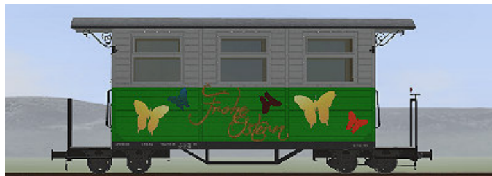
GPW 16 – Wagen in Grün-Weiß – (Modellname: WEM_Pers Ostern 2017_2 – enthalten in: V80N_WBF_Ostern2017)