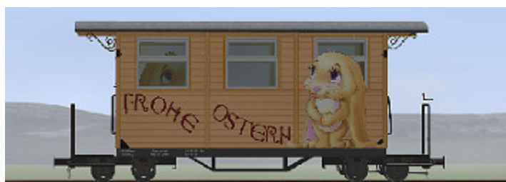
GPW 16 – Wagen in Gelb – (Modellname: WEM_Pers Ostern 2017_3 – enthalten in: V80N_WBF_Ostern2017)