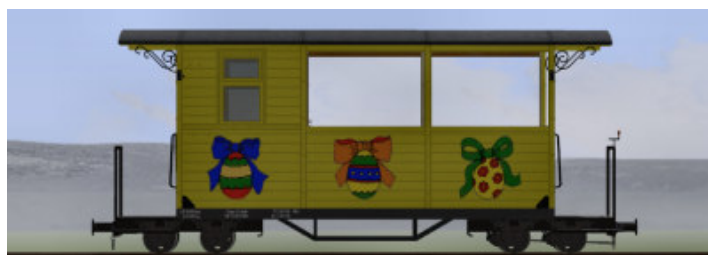
Buffetwagen in Gelb – (Modellname: WEM_Buffetwagen Ostern – enthalten in: V80N_WBF_Ostern2015_02) Diese Version besitzt nur 8 Sitzplätze an 4 Tischen.